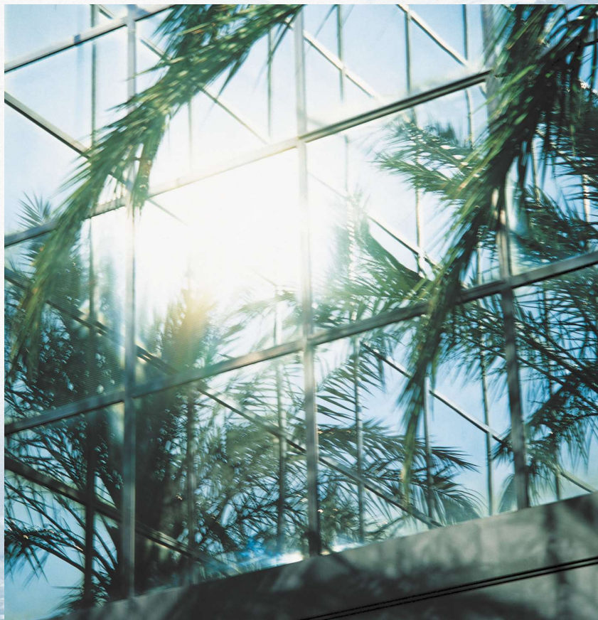
B10. Cronoprogramma Lavori

Project Financing, ai sensi dell'art. 193 del D.Lgs. n. 36/2023, per l'affidamento in concessione della gestione dei servizi cimiteriali e del servizio lampade votive nel Cimitero Comunale di Afragola.